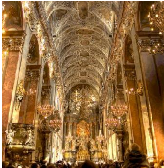
Madonna Nera di Czestochowa