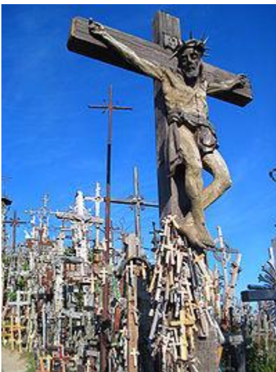
Šiauliai la collina delle croci