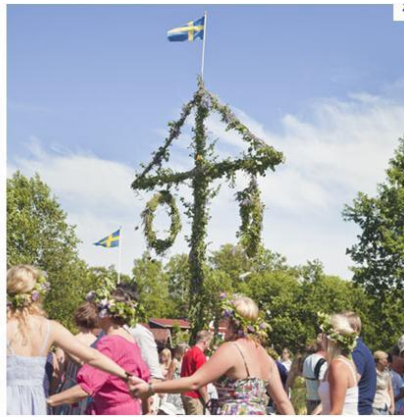
Festa di mezz'estate